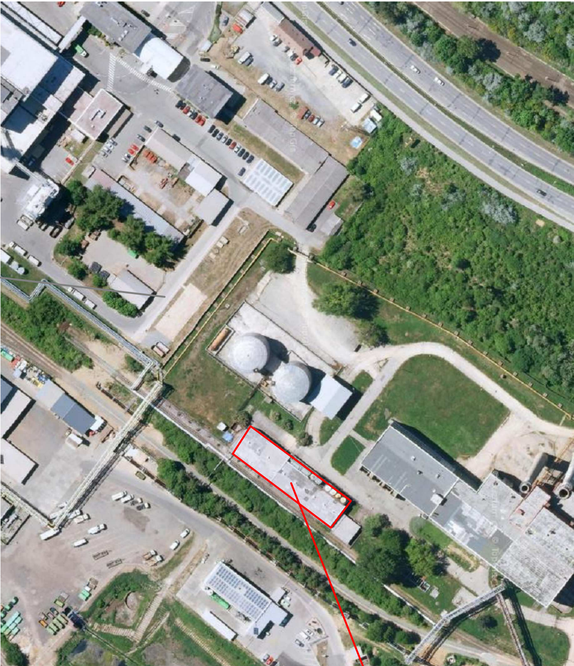
SO 542 DÍLNÝ MECHANICKÉ ÚDRŽBY A DÍLNÝ VEDLEJŠÍCH PROVOZŮ